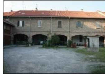
7 CASCINA SAN FIORANO Via San Fiorano

Farmhouse CASCINA RECALCATE C. Menotti Road