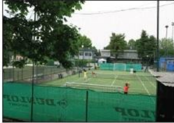
2 CAMPO SPORTIVO M. CASTOLDI Via G. Mameli

Farmstead CASCINA AUTUNNO del Boschi Road