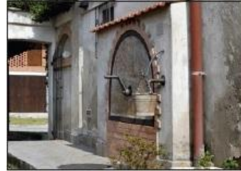
6 POZZO Via San Fiorano