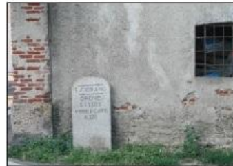
8 ANTICO CIPPO ROMANO Via San Fiorano

ANCIENT BOUNDARY MARKER San Fiorano Road