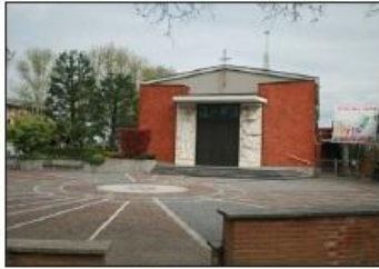
1 CHIESA DI SAN FIORANO Piazza Paolo VI