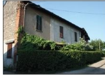
5 CASCINA AUTUNNO Strada dei Boschi

Farmstead CASCINA AUTUNNO del Boschi Road