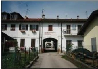
3 CASCINA RECALCATE Via C. Menotti

Farmhouse CASCINA RECALCATE C. Menotti Road