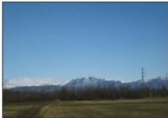
4 PARCO DELLA CAVALLERA

Farmhouse CASCINA SAN FIORANO San Fiorano Road