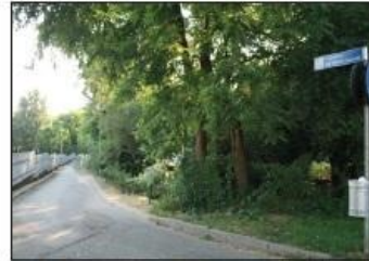
7 CICLOPEDONALE MULINI ASCIUTTI

SAN GIORGIO AL LAMBRO Monza Royal Park Entrance