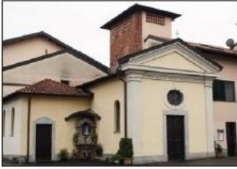
1 CHIESA SANT'ALESSANDRO Piazza Sant'Alessandro

SANT'ALESSANDRO CHURCH Sant'Alessandro Square