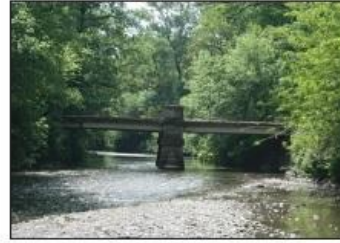
5 PONTE DEI BERTOLI Parco Reale di Monza

SANT'ALESSANDRO CHURCH Sant'Alessandro Square