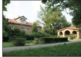
6 MULINI ASCIUTTI Parco Reale di Monza

BRIDGE ON THE LAMBRO RIVER F. Baracca Road