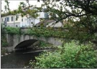
2 PONTE SUL FIUME LAMBRO Via F. Baracca

BRIDGE ON THE LAMBRO RIVER F. Baracca Road