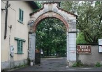
3 SAN GIORGIO AL LAMBRO Ingresso Parco Reale di Monza

SAN GIORGIO AL LAMBRO Monza Royal Park Entrance