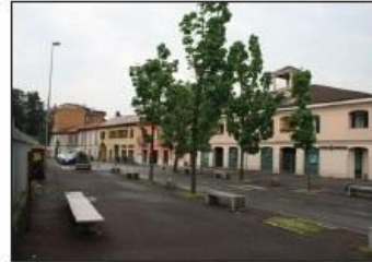
8 PIAZZA L. DAELLI Incrocio percorso verde e azzurro

L. DAELLI SQUARE Here crossing the green and the light blue routes