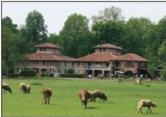
4 MULINI SAN GIORGIO Parco Reale di Monza