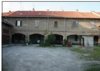
5 CASCINA SAN FIORANO Via San Fiorano