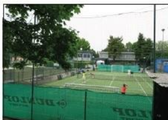
8 CAMPO SPORTIVO M. CASTOLDI Via dei Mille

ANCIENT BOUNDARY MARKER San Fiorano Road