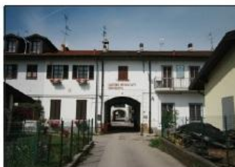
7 CASCINA RECALCATE Via C. Menotti

FARMHOUSE CASCINA RECALCATE C. Menotti Road