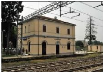
1 STAZIONE FERROVIARIA Via B. Cellini