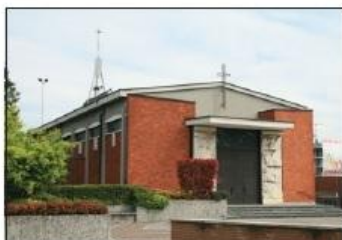
3 CHIESA SAN FIORANO Piazza Paolo VI