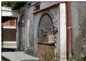
6 POZZO SAN FIORANO Via San Fiorano