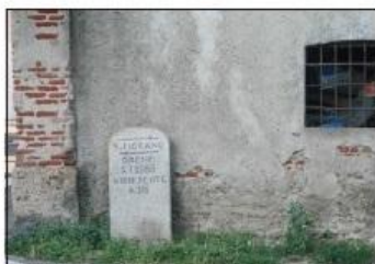
4 ANTICO CIPPO ROMANO Via San Fiorano

FARMHOUSE CASCINA RECALCATE C. Menotti Road