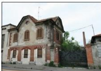
2 FABBRICA TRONCONI Via G. Garibaldi