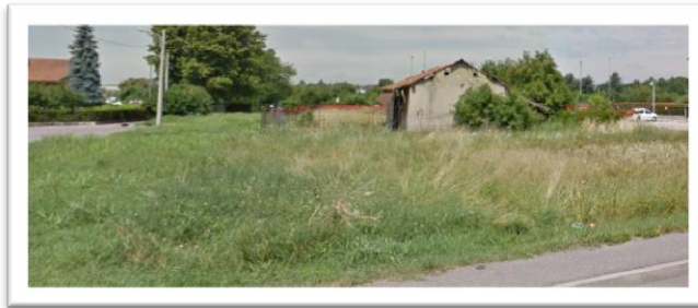
Immagine 5 - area De Cesaris all'angolo Via dei Mille e via Sciesa