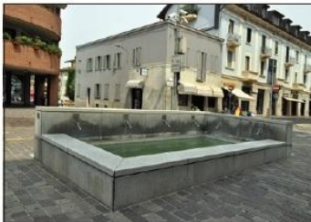
2 FONTANA DELLE ROGGE Piazza F. Camperio

FOUNTAIN OF IRRIGATION DITCHES F. Camperio Square