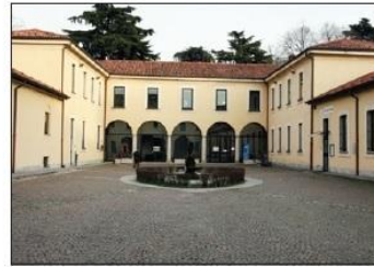
5 VILLA CAMPERIO Via F. Confalonieri

TOWN HALL MOTHER'S FAREWELL Martiri della libertà Square