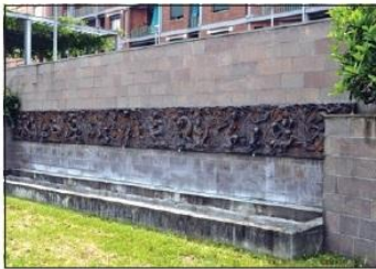
4 BASSORILIEVO Via A. Negri

MUAS (Museum of Sacred Art) Martiri di Belfiore Square