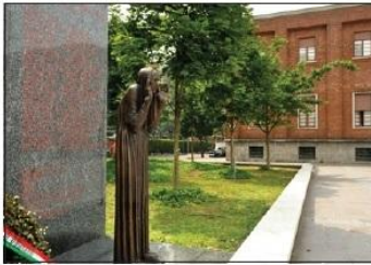
1 COMUNE DI VILLASANTA MADRE BENEDECENTE Piazza Martiri della libertà

TOWN HALL MOTHER'S FAREWELL Martiri della libertà Square