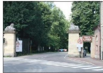
8 INGRESSO PARCO DI MONZA Viale Cavriga