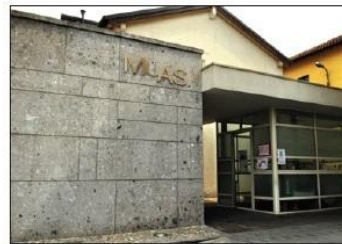
7 MUAS Piazza Martiri di Belfiore

MUAS (Museum of Sacred Art) Martiri di Belfiore Square