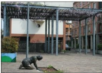
3 LA LAVANDAIA Piazza Don Gervasoni

SANT'ANASTASIA CHURCH Martiri di Belfiore Square