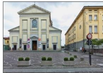
6 CHIESA SANT'ANASTASIA Piazza Martiri di Belfiore

FOUNTAIN OF IRRIGATION DITCHES F. Camperio Square