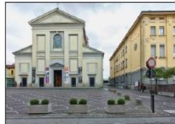
7 CHIESA SANT'ANASTASIA Piazza Martiri di Belfiore

SANT'ANASTASIA CHURCH Martiri di Belfiore Square