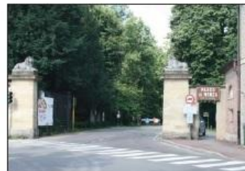
8 INGRESSO PARCO DI MONZA Viale Cavriga