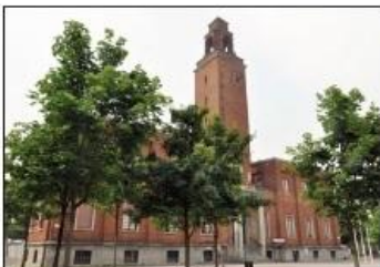
4 COMUNE DI VILLASANTA Piazza Martiri della libertà

SANT'ANASTASIA CHURCH Martiri di Belfiore Square