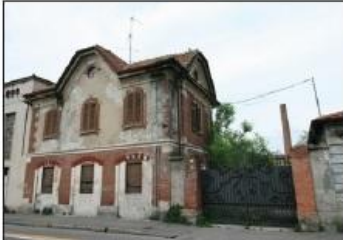
2 FABBRICA TRONCONI Via G. Garibaldi

FOUNTAIN OF IRRIGATION DITCHES F. Camperio Square