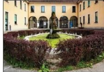
6 VILLA CAMPERIO Via F. Confalonieri