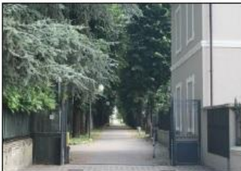
3 PARCO RODARI Via G. Garibaldi