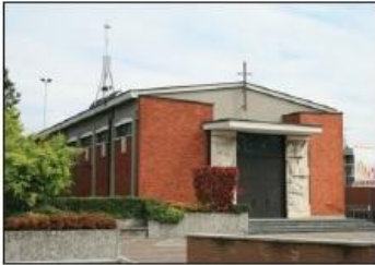
1 CHIESA DI SAN FIORANO Piazza Paolo VI