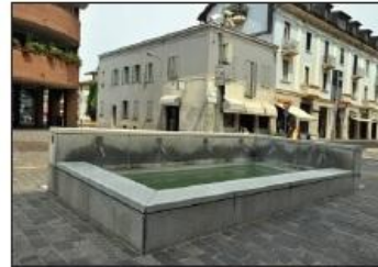
5 FONTANA DELLE ROGGE Piazza F. Camperio

FOUNTAIN OF IRRIGATION DITCHES F. Camperio Square